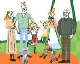
Illustration © LIXIL + SHIRUSHI All Rights Reserved.

耐震化を高め、エコ住宅に長く住んでいただくために、持ち家の省エネ性能を向上させるリフォーム(エコリフォーム)に対して補助金がもらえます。リフォーム後の住宅が耐震性を有することが条件です。